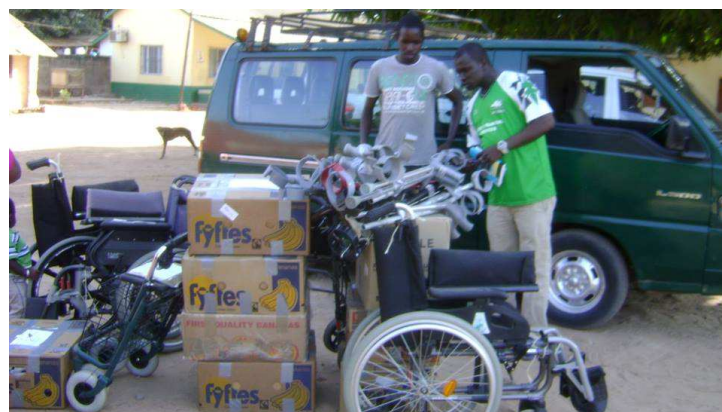
Foto: uitpakken goederen op terrein Brikama ziekenhuis te Gambia